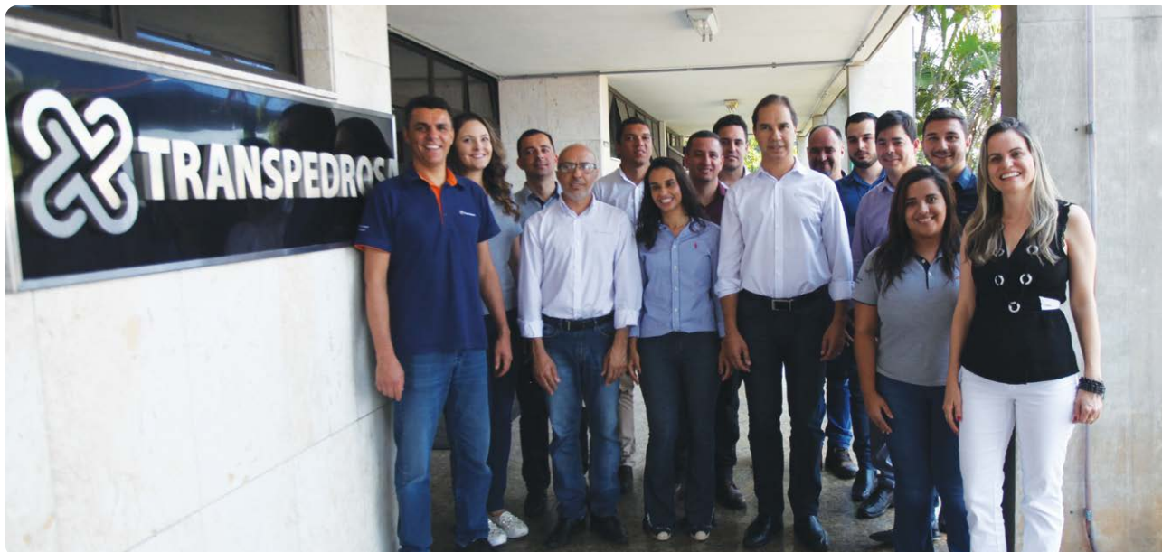
Gás novo e renovado na liderança da Transpedrosa

Em tempos de inovações, mudanças acontecendo a cada instante, diversidade de oportunidades e um mundo cada vez mais competitivo, as empresas precisam se preparar, com inteligência, dinamismo e criatividade. Pensando nisso, a Transpedrosa se movimentou e reformulou aquilo que acredita ser o nosso maior diferencial do negócio: as Pessoas - nosso Time.