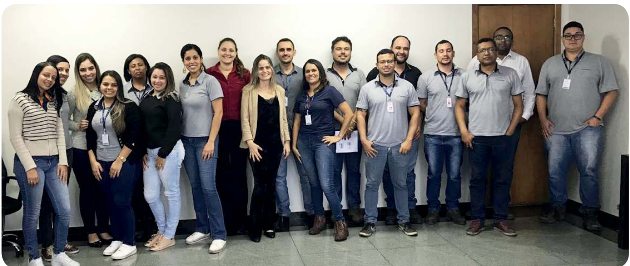
Equipe da Transpedrosa realizou treinamento de auditoria interna, com o objetivo de garantir a excelência de processos e serviços da empresa