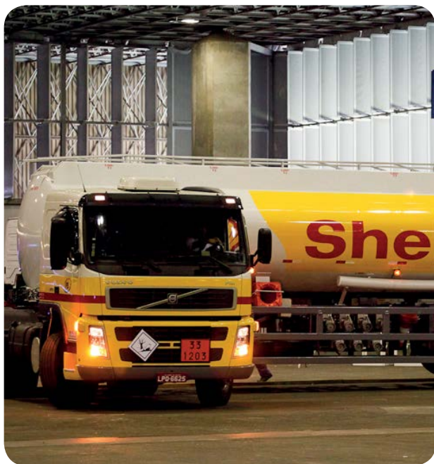
Está preparado para o 9º Rodeio de Caminhões Raízen? Transpedrosa sediará uma das etapas regionais. Fique ligado!