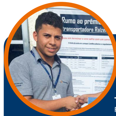
Thales Oliveira Filial Candeias (BA)

Não deixe de participar! Acesse o Portal Boas Ideias ou utilize o formulário físico disponibilizado nas filiais!